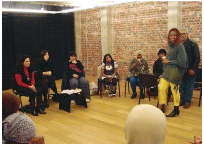
▲ Réflexions et échanges en groupe