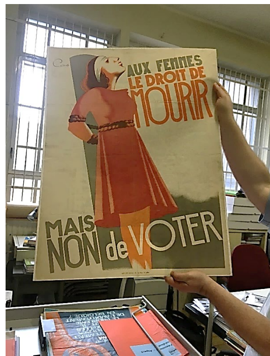
Aux femmes le droit de mourir, mais non de voter, affiche de Cos, 1946

Ils avaient l'art de la typographie et du graphisme... Qu'est-ce qu'on peut trouver d'autre ? il y en a plein mais certaines sont juste des affiches d'événements, ici en lien avec le féminisme. Par exemple le Café des Femmes. Ici... je ne sais pas ce que c'est. Ah, il y en a en lien avec l'avortement. Nous avons le fonds Willy Peers, un médecin qui a été en prison pour avoir pratiqué des IVG.