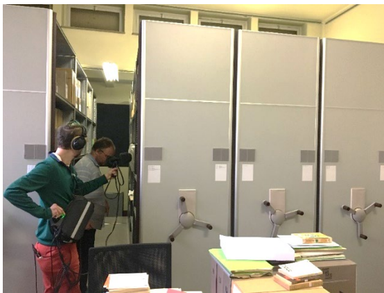
Le compactus de l'IHOES