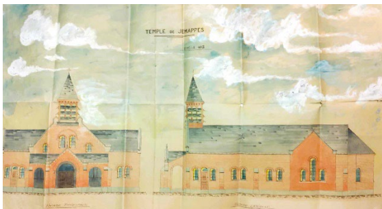
Temple de Jemappes, aquarelle, 1906

Le 412, on a quelques affiches protestantes, celles-ci sont particulièrement amusantes. Il y a toute une polémique qui se déclenche au XIX e siècle entre protestants et catholiques, cette querelle prend un caractère particulièrement vif à Bois-de-Boussu, un petit village dans la région du Borinage. On a un dialogue entre le pasteur et le curé via des affiches placardées sur les murs.