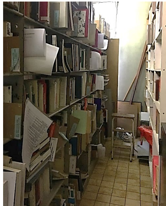
Une partie de la bibliothèque à l'IHOES

JL ... les fusions, les déménagements (souvent ça va de pair), les travaux dans les bâtiments. Il peut aussi arriver un accident dans les archives et souvent le producteur se demande s'il jette tout ou s'il y a moyen de sauver quelque chose.