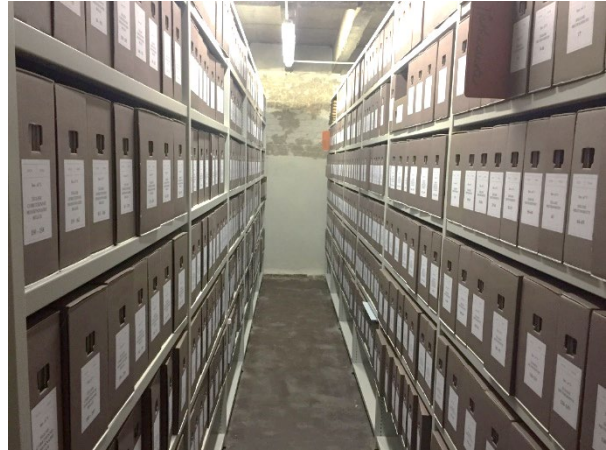
Centre d'archives de l'EPUB

reproduise plus, parce que là, c'est ce qu'on peut appeler du « vrac numérique ». Si on doit faire l'inventaire comme on vous a montré tout à l'heure à la cave avec le papier, on va devoir ouvrir chaque fichier, ce n'est pas possible. Ce que nous avons ici existe un peu partout : des centaines de dossiers à traiter, ou mal identifiés.